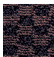
Marrone terra bruciata